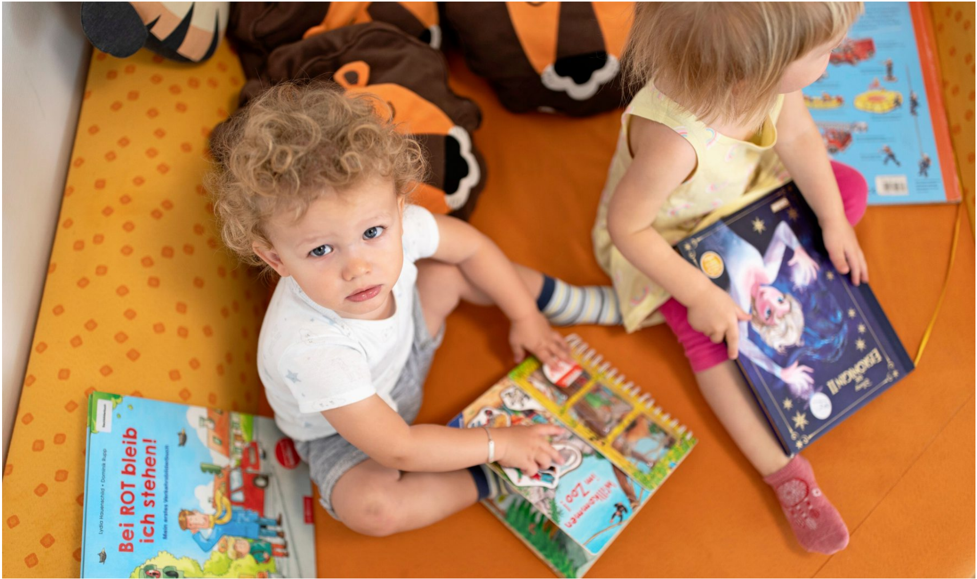
Werden immer öfter von grossen Unternehmen betreut: Kinder in einer Kita.